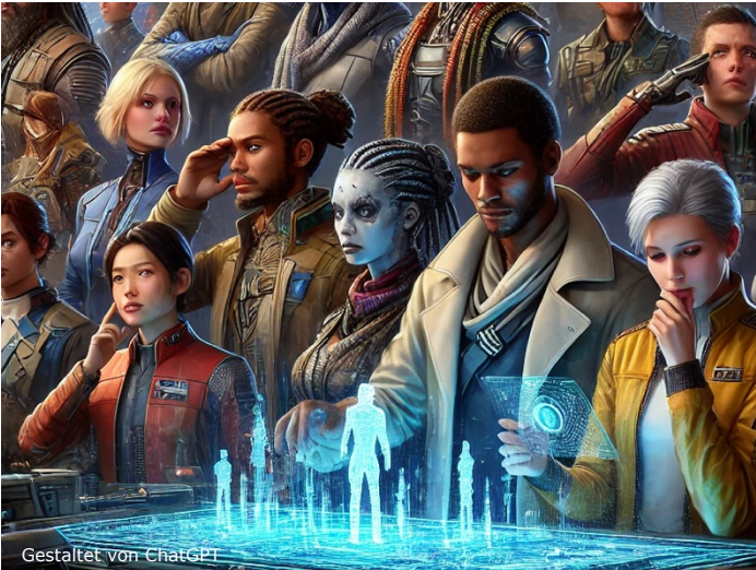
Gestaltet von ChatGPT

Kurzbeschreibung: Anthropen sind Menschen, die im Weltall fast überall vertreten sind. Sie sind sozial-gesellschaftliche Wesen, deren Charakteristika aber völlig unterschiedlich ausfallen.